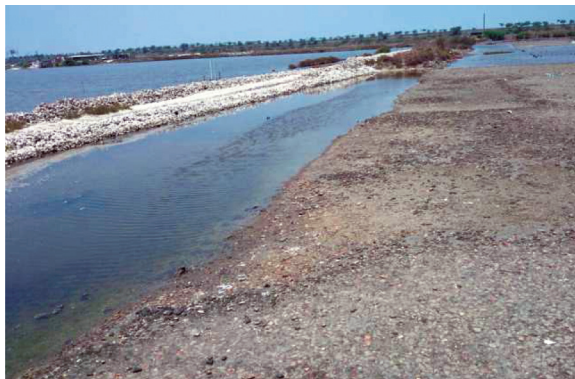
圖二 廢棄鹽田一景