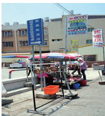
圖五 北門美食街旁的地方攤販