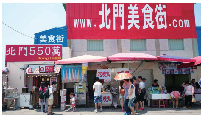
圖四 北門美食街標誌房價「北門550萬」的廣告