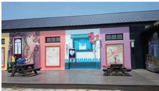
圖三 北門遊客中心彩繪牆面