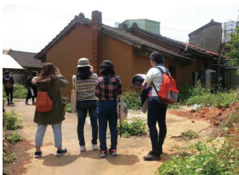
圖四 臺中城市發展田調團訪調過程