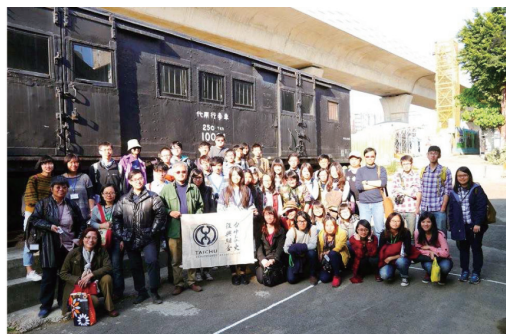
圖二 臺中文史復興組合活動