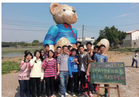
圖五 臺中地景藝術節與其志工