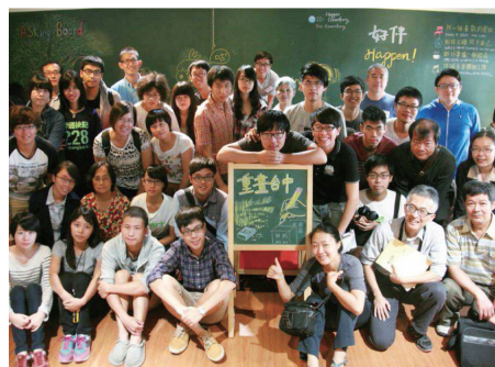
圖三 臺中城市發展田調團舉辦重劃臺中